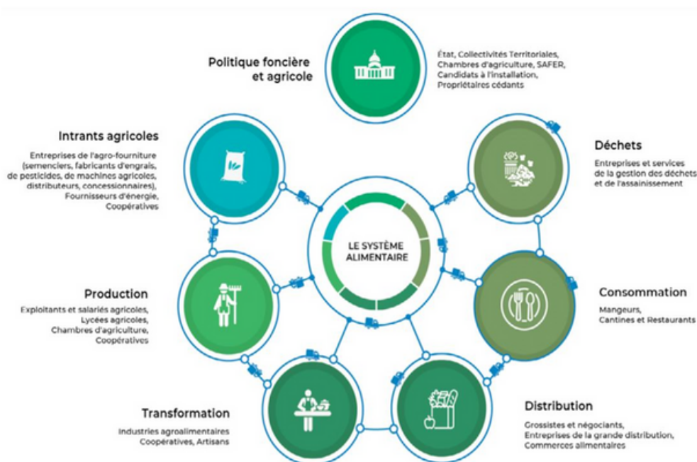
Schéma simplifié d'un système alimentaire

La première réunion d'information aura lieu le 29 septembre, de 18h à 20h (le lieu sera communiqué par la suite) . Cette rencontre aura pour ordre du jour de revenir sur l'axe de travail du PAT, "Sensibiliser les citoyens-consommateurs", et d'introduire les mécanismes de jeu pour répondre à cet objectif.