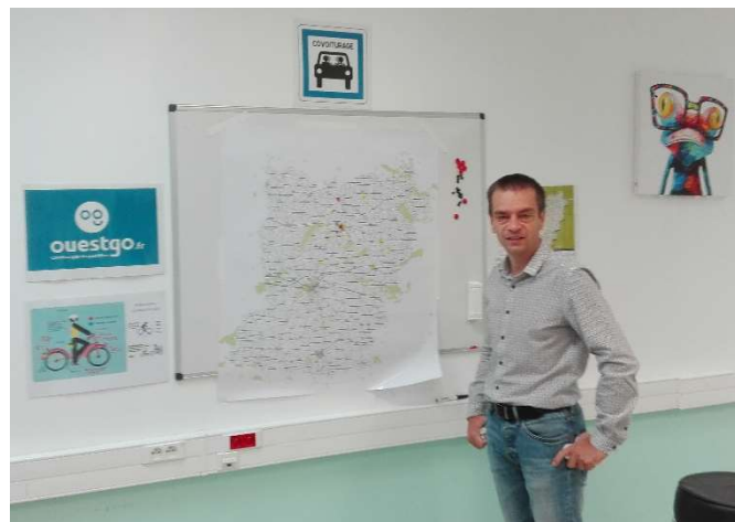
Entreprise Jouve, Mayenne